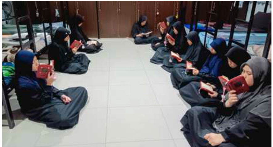
Kegiatan tilawah A-Qur'an santri IBS Insantama jelang tidur malam hari.

"Bagus karena merupakan bentuk penjagaan diri kita di kamar. Bila kita sering melakukannya, maka suasana kamar yang tempat kita memulai dan mengakhiri rutinitas setiap harinya akan semakin lebih baik lagi," ujarnya.