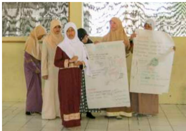
Pelatihan public speaking angkatan pertama SMAIT Insantama Bogor, 2010.