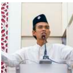
Ustadz Abdul Somad