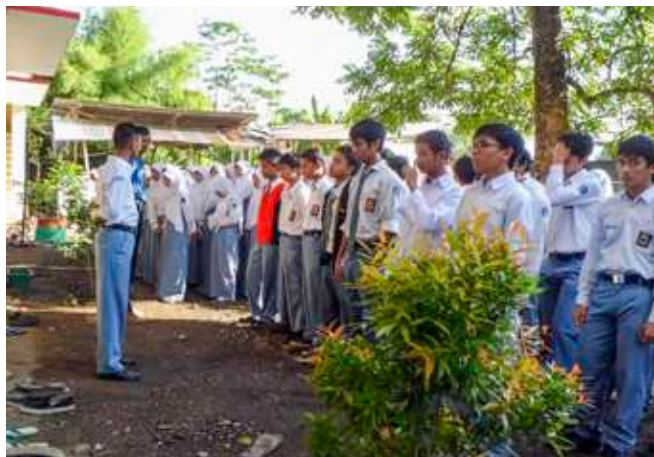
Apel pagi SMAIT Insantama Bogor di bangunan awal, 2011.