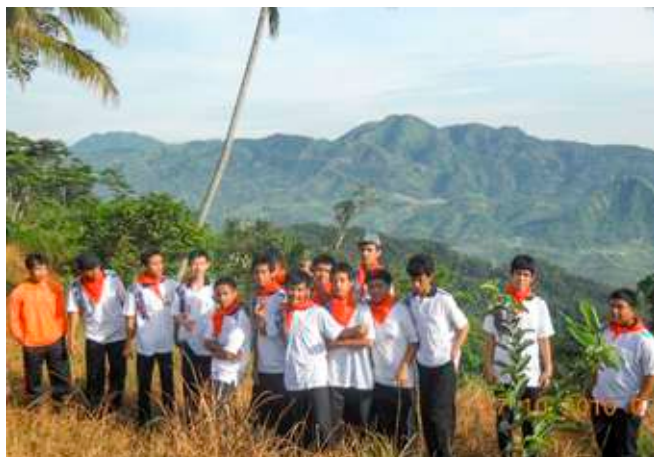
Latihan Dasar Kepemimpinan (LDK) Taklukkan Cianjur, pertama kali diselenggarakan, 2010.