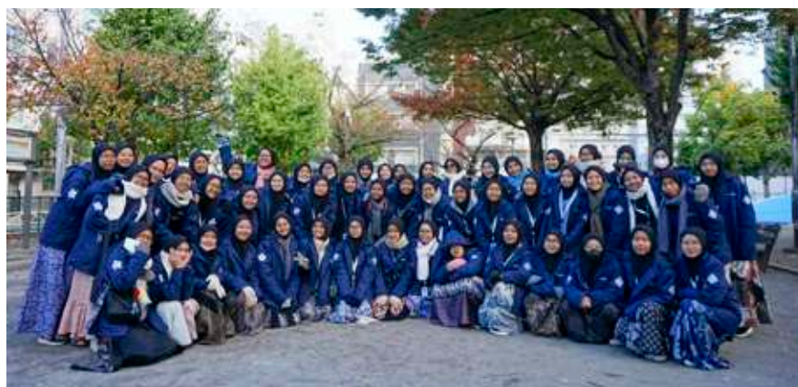
LKMA 2024 - Thrive to Japan next to Brunei.

Pak Kar menjelaskan, banyak pihak perwakilan universitas luar negeri yang dikunjungi oleh anak-anak SMAIT Insantama yang mengikuti kegiatan Latihan Kepemimpinan Tingkat Akhir (LKMA) merasa bahwa anak-anak SMA ini justru lebih terlihat seperti anak kuliah semester 7.