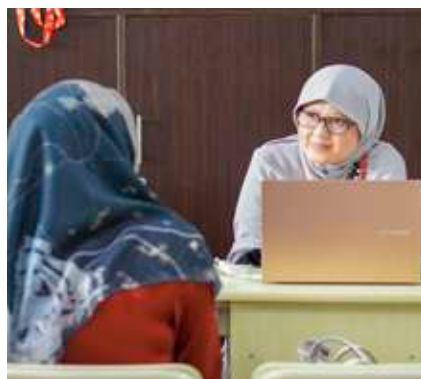
Wawancara orang tua calon siswa baru.

Tidak ada yang salah dengan beragam alasan itu. Yang menarik