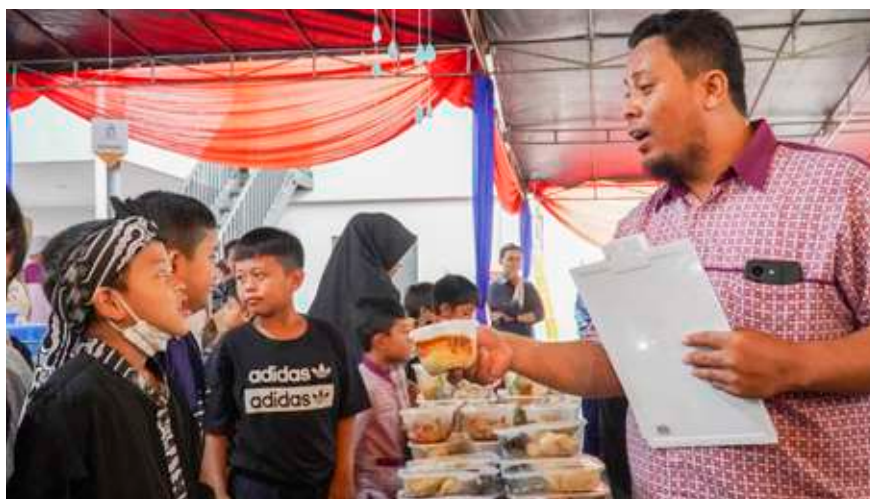
Siswa berdagang di Insantama Market Day.

Di lingkungan sekolah, anak-anak belajar bagaimana mengelola emosi, memahami perasaan orang lain, serta mengembangkan rasa percaya diri. Anak juga belajar tentang ketekunan, tanggung jawab, dan cara mengatasi tantangan, pembentukan karakter, yang