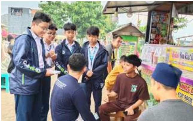
Salah satu tim LMT-4 SMPIT Insantama Bogor, Gluminous Ignite In Pare, sedang melakukan wawancara berbahasa Inggris dengan pengunjung Pasar Senja, Kampung Inggris, Pare, Kediri Jawa Timur.

Pertama, Gluminous wawancara berbahasa Inggris kepada pelintas jalan secara acak di Pasar Senja. Akhwat pada Kamis