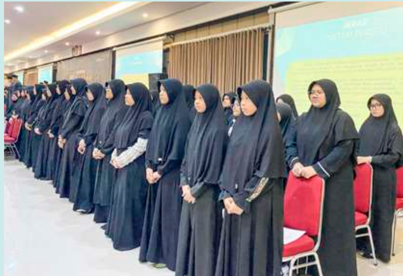
Santri IBS Insantama mengikuti Pengukuhan Tim Beregu.

Menurutnya, seluruh santri boarding berjuang bersama untuk pendidikan di dunia dan untuk bekal berpulang ke surga-Nya di akhirat kelak. Agar terorganisasi dengan baik maka semuanya harus rela dipimpin dan bersedia bila dijadikan pemimpin, pemimpin yang taat kepada Allah SWT sesuai dengan visi misinya Insantama.