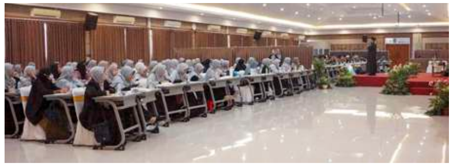
Suasana pelaksanaan PPKK di Auditorium SIT Insantama Bogor.

"Alhamdulillah sangat berkesan sekali, pertama saya ucapkan banyak terima kasih kepada panitia, dan tentunya tidak lupa juga kepada Yayasan Insantama, yang telah mengadakan kegiatan PPKK ini. Kami sebagai karyawan tentunya merasakan adanya