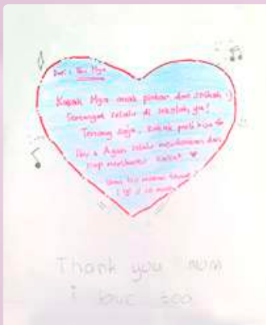
Pesan Cinta yang ditempelkan di buku tulis ananda.