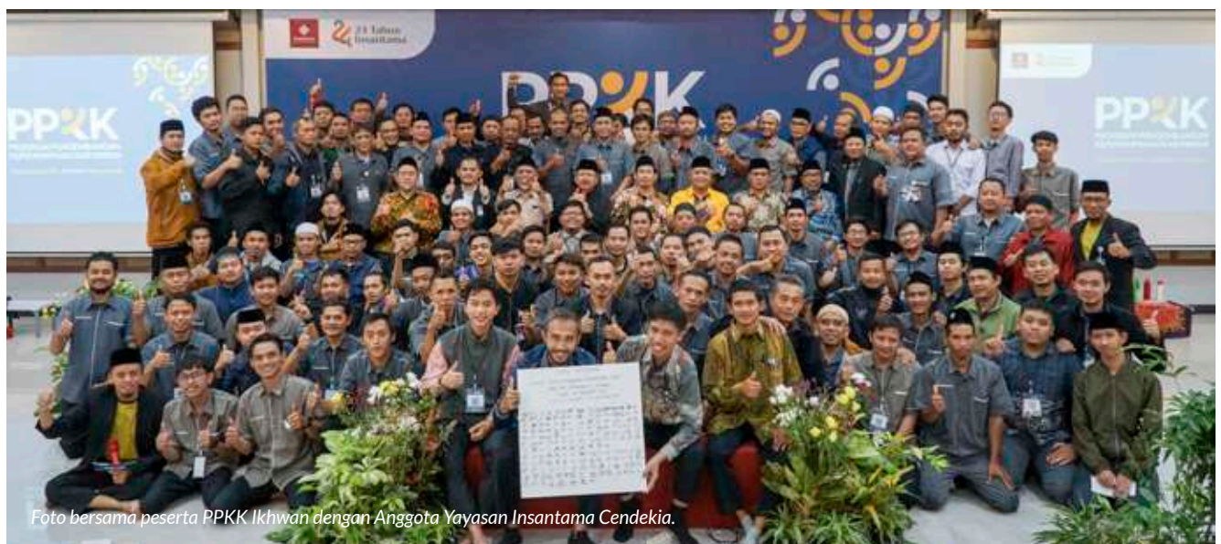
Foto bersama peserta PPKK Ikhwah dengan Anggota Yayasan Insantama Cendekia.