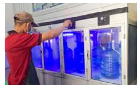
Proses pengisian air minum Airatama.

Proses filter di Airatama dilakukan dalam dua proses, yaitu proses penyaringan pada media filter dengan tiga bahan berkualitas dan berikutnya penyaringan pada cartridge filter .