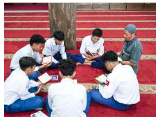
Pak Masta kebersamaan siswa SMP di kelas Tahfizh.

Harapannya akan mudah untuk selalu shalat berjamaah di masjid, sekaligus pekerjaannya ini akan membawa