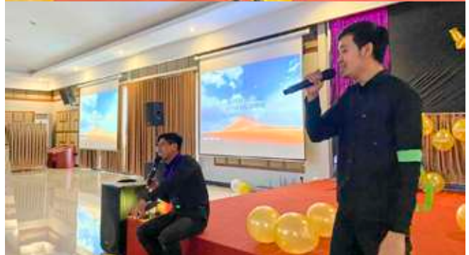
Penampilan guru-guru SMAIT Insantama di acara penyambutan Back to School .

Selain itu, tayangan motivasi tentang kegiatan siswa seperti fundraising (pencarian dana) untuk berbagai kegiatan kesiswaan pun diparodikan, bertujuan untuk penguatan mental siswa, bahwa mereka mempunyai daya juang yang baik dalam kegiatan tersebut.