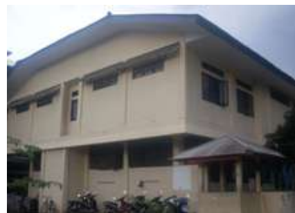
Gedung Aula dua lantai, sebelum dibangun MPI.

Biaya pembangunan MPI kurang lebih Rp7,5 miliar sudah termasuk lantai 1 yang difungsikan sebagai front office , kantor, unit kesehatan sekolah, perpustakaan, unit layanan, masjid lantai 2 untuk ikhwan dan lantai 3 untuk akhwat serta sound system -nya juga. Biayanya yang Rp1,3 miliar dari wakaf dan selebihnya dari internal yayasan.