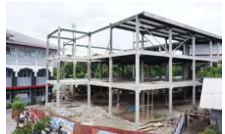
Proses pembangunan Masjid Pendidikan Insantama, 2016.