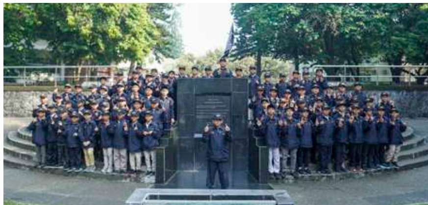
Delegasi Leadchamps Angkatan 19 SDIT Insantama Bogor, berikrar di ITB.

Satu kegiatan kesiswaan harus diikuti oleh semua. Tidak ada satu kegiatan kesiswaan yang tidak diikuti oleh semua. Itu tidak ada. Semua harus merasakan hal yang sama. Nah, situasi begini, respons dari pihak lain itu mengatakan tadi, “Ini anak-anak diapain? ” lalu “Anak-anak kok begini?” lalu “(Anak SMA) kok tidak seperti siswa SMA?” dan lain sebagainya.