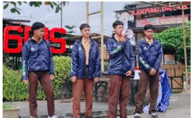
Tim LMT-4 SMPIT Insantama Bogor, Gluminous Ignite In Pare, sedang melakukan Speech Contest dengan menggunakan bahasa Inggris di Landmark Kampung Inggris, Pare, Kediri Jawa Timur.

Kedua, Gluminous orasi di Landmark Kampung Inggris. Pada Senin (20/1/2025), ada 11 kelompok yang berorasi dimulai dari kelompok akhwat yaitu Mecca, Madina, Elhambra, Cordova, Granada, dan dilanjutkan dengan kelompok ikhwan yaitu El-Quds, Baghdad, Constantinople, Cairo, Damascus, dan Istanbul.