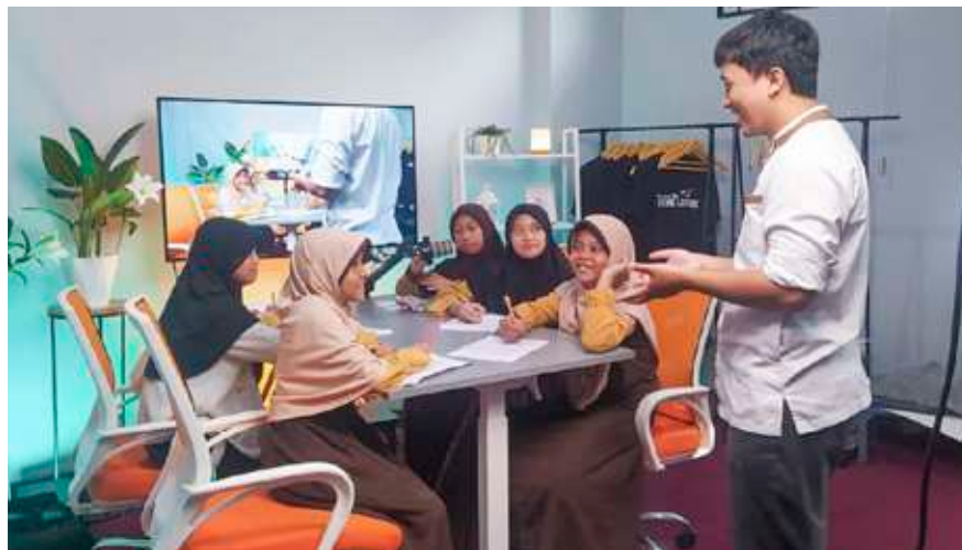
Kunjungan siswa ke kantor Tim Media SIT Insantama Bogor.

“Kami bertanggung jawab atas keperluan IT SIT Insantama, membuat konten dan membuat produk media. Tugas kami pun beragam, ada yang