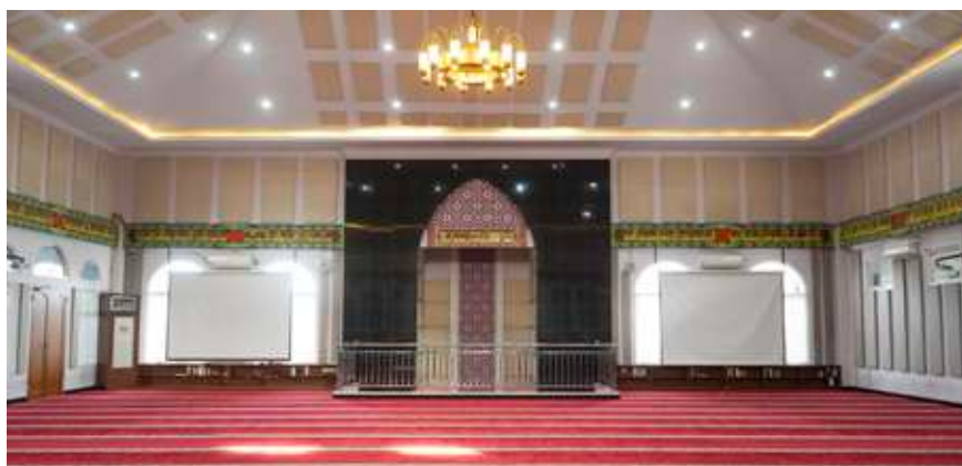
Ruang MPI lantai tiga.

Selain itu, Insantama juga memiliki program Ramadhan, melibatkan seluruh unit. Semua unit dari SD, SMP, SMA dan boarding , akan memiliki jatah untuk melakukan kegiatan yang begitu padat di masjid selama bulan penuh berkah Ramadhan.