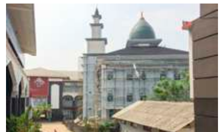
Proses pembangunan Masjid Pendidikan Insantama, 2017.