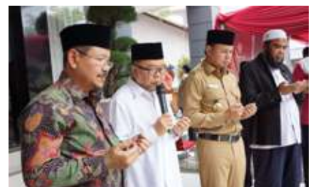
Peresmian Masjid Pendidikan Insantama bersama KH Didin Hafidhuddin dan Wali Kota Bogor 2014-2024 Dr. Bima Arya Sugiarto, 2018.

shalat Zhuhur kepada para jamaah yang telah memadati bagian utama masjid. Prosesi acara peresmian sendiri diakhiri dengan menunaikan shalat berjamaah dan ramah-tamah usai shalat dengan menyantap hidangan makan siang.