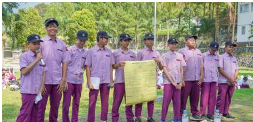
Presentasi hasil analisis kondisi lingkungan Desa Cijeruk, LMT 2 SMPIT Insantama Bogor, 2024.