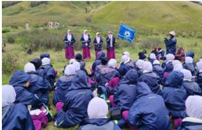
Delegasi LMT 4 SMPIT Insantama Bogor melakukan orasi di Kaki Lembah Watangan, Bromo.

Ketiga, Gluminous menggelar "Panggung besar" public speaking di kaki Lembah Watangan, Bromo, suarakan Remaja Baper (Bawa Perubahan).