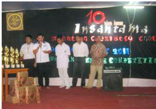
Smention pertama kali, bertepatan dengan peringatan 10 tahun Insantama, 2011.