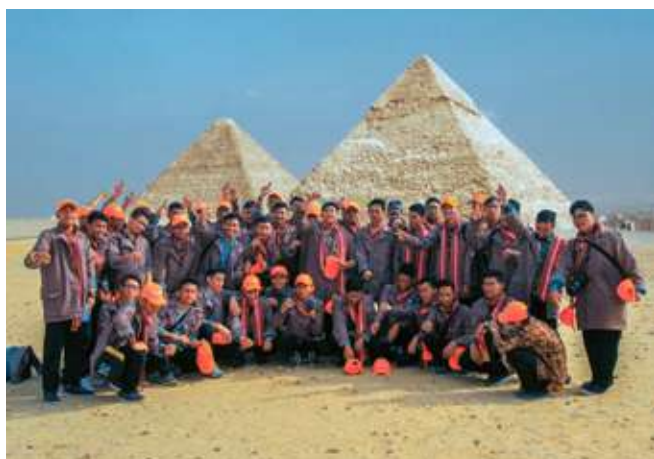
LKMA 'Sails to Egypt', 2019.